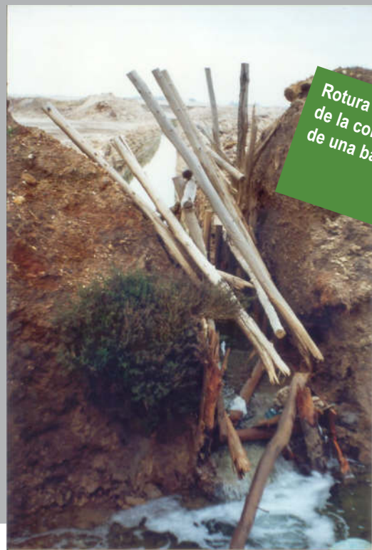
Rotura perimetral de la contención de una balsa