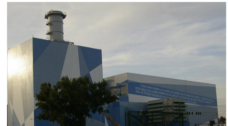
También Juan Ramón dijo esto:

NO SÓLO CONSTRUYEN UNA NUEVA CENTRAL TÉRMICA SIN LICENCIA, SINO QUE TIENEN LA DESVERGÜENZA DE UTILIZAR SOBRE LA MISMA UNAS LETRAS DE JUAN RAMÓN JIMÉNEZ DE SU LIBRO «PLATERO Y YO», ESCRITO EN 1915. JUAN RAMÓN JIMÉNEZ MURIÓ EN 1958, ANTES DE LA IMPLANTACIÓN DEL POLO QUÍMICO. «EL VERGEL» AL QUE SE REFERÍA NUESTRO MOGUERENO POETA HOY NO EXISTE. Y SI VIVIESE, VERÍA LO QUE EN SU LUGAR HAY: CONTAMINACIÓN Y MUERTE, PUES YA EN SU ÉPOCA FUE CAPAZ DE VER LA QUE PRODUCÍA LA EXPLOTACIÓN DE LAS MINAS DE RIOTINTO.