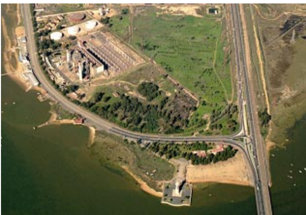
Antes: El TSJA, no sabe si es nueva o una reforma de la vieja. Si es nueva, el PGOU no la permite.

Sabías que los de siempre defienden la seguridad jurídica de las empresas, que ya la tienen, y nunca la seguridad del empleo.