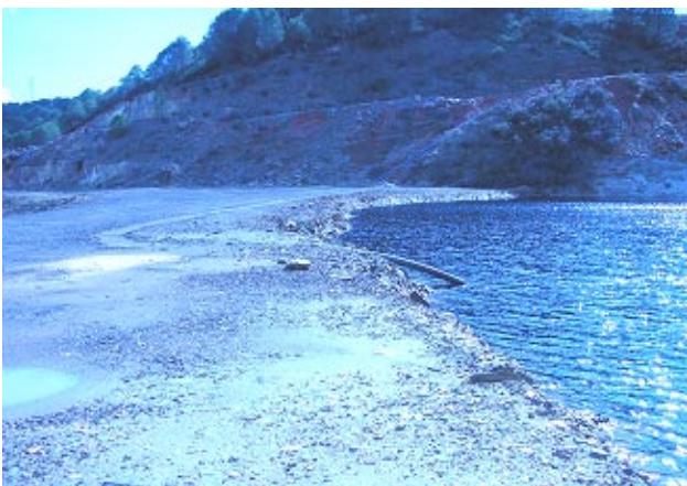
FOTO DEL EMBALSE LLENO (Antes de las denuncias a las Autoridades)

Sabías que el CSIC ha cambiado por tres veces sus informes sobre el número de térmicas que pueden operar en la ría.