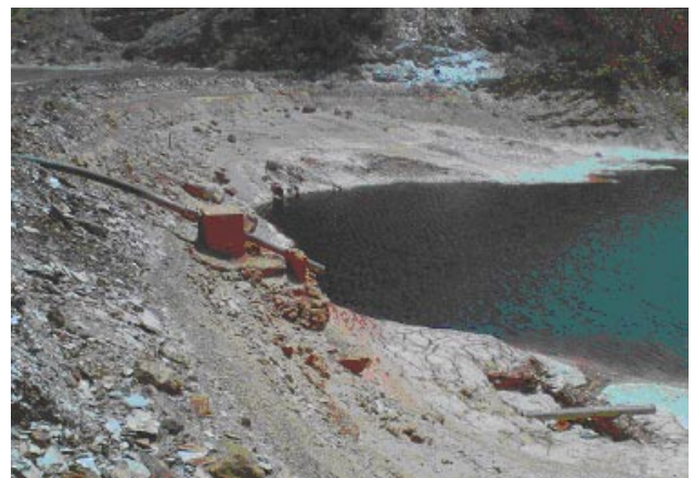
FOTO DEL EMBALSE VACÍO (Después de las denuncias y del vertido al Río Tinto)