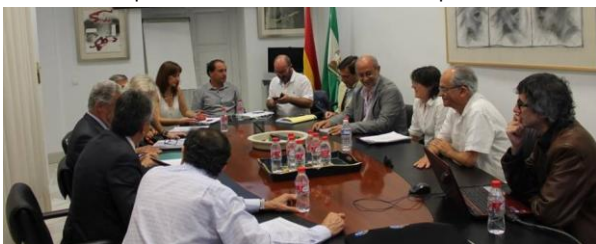
Reunión del Defensor del Pueblo Andaluz con la SEE y Recupera Tu Ría

El Dictamen hecho público en 2014 subraya que “se desconocen las razones concretas de la mayor mortalidad de la Ría de Huelva”, aunque pone de manifiesto un importante incremento de mortalidad por cáncer.